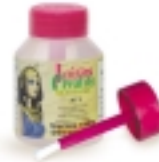
Le plus pratique réf : LCC3-80P